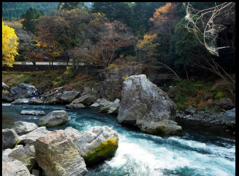
飛沫をあげる溪流