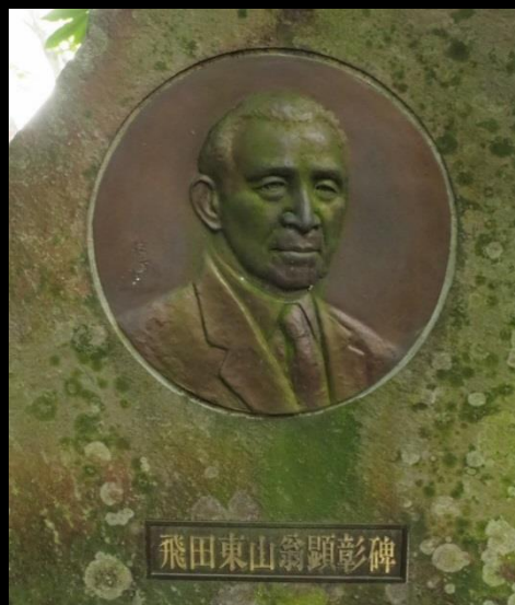
飛田東山翁顕彰碑