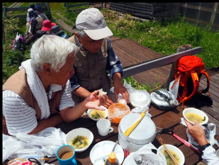
楽しいランチタイムです♪