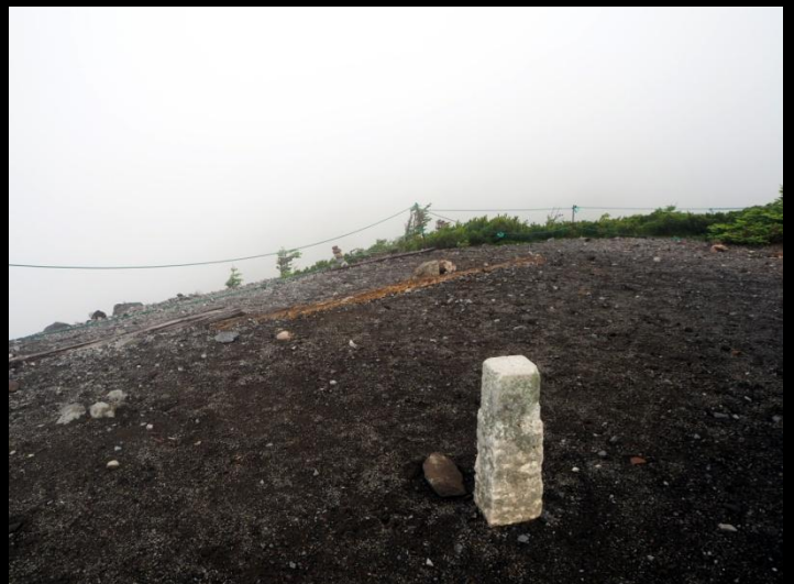
山頂の三角点…重い石を背負って設置