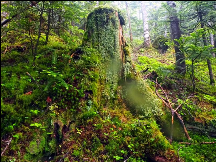
八ヶ岳は苔が多彩… ♪